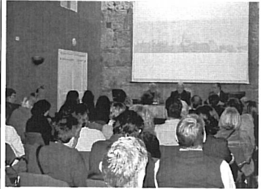
Imatge de la jornada sobre la Part Alta de Tarragona

Es considera també la possibilitat d'organitzar unes jornades per estudiants o personal de l'Autoritat Portuària de Tarragona per tal de divulgar l'estudi que s'està realitzant entre els estudiants i també entre personal de l'entitat. I amb les dades obtingudes, l'APT podrà organitzar qualsevol fòrum de discussió o difusió en diferents mitjans de comunicació. Per aquesta activitat, l'APT comptarà amb l'ajut del Grup de Cromatografia i Aplicacions Mediambientals de la Universitat Rovira i Virgili de Tarragona.